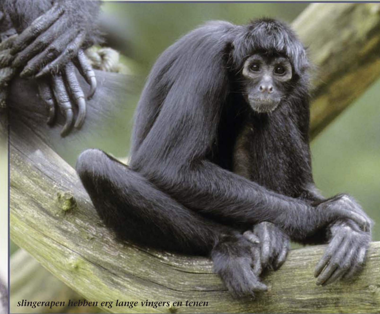
slingerafen hebben erg lange vingers en tenen

Wie niet met slingerapen vertrouwd is, ziet de vrouwtjes vaak voor mannetjes aan. De vrouwtjes hebben namelijk een roze ‘aanhangel’, onder hun staart hangen. Dat is echter geen penis, maar een clitoris. Waarom deze zo groot is, is onduidelijk. Sommige onderzoekers denken dat de clitoris bij slingerapen een functie bij de geurcommunicatie heeft. Anderen denken dat het een anatomische aanpassing is, een soort ‘plaspootje’ dus, voor als ze aan hun staart hangen en ondersteboven plassen.