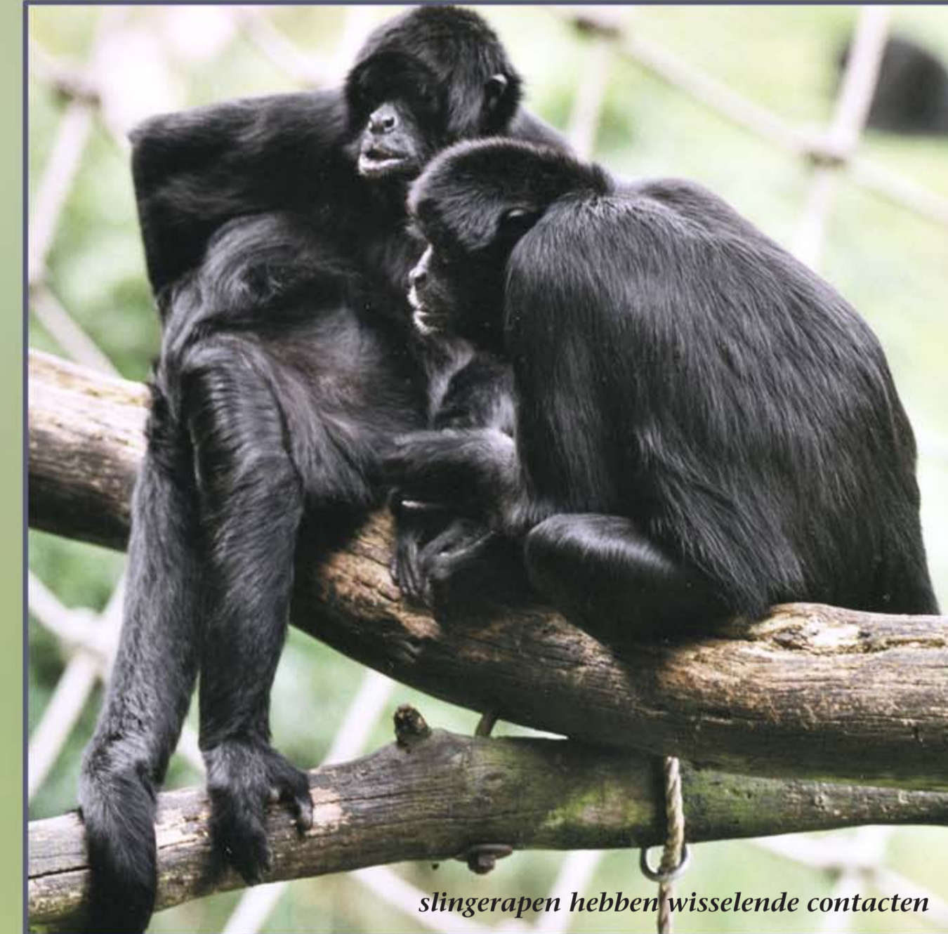
slingerafen hebben wisselende contacten