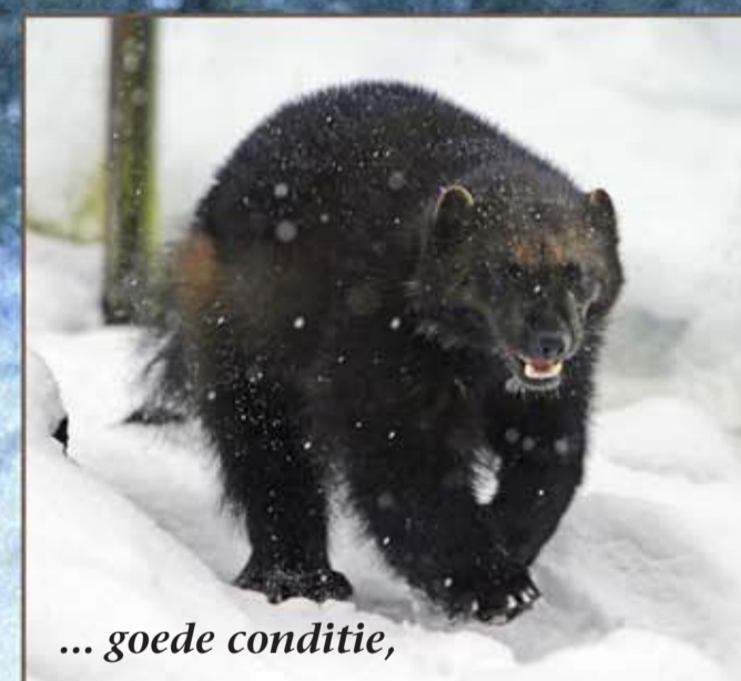
... goede conditie,