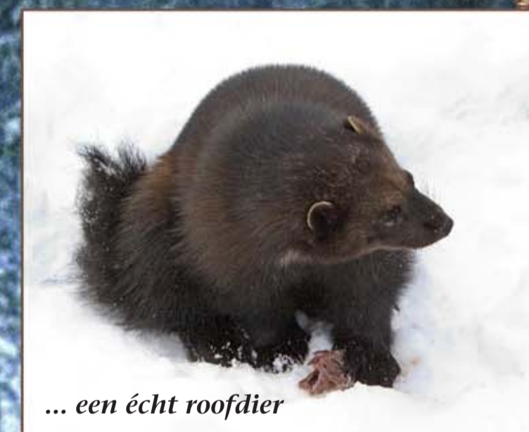
... een écht roofdier