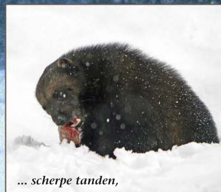
... scherpe tanden,