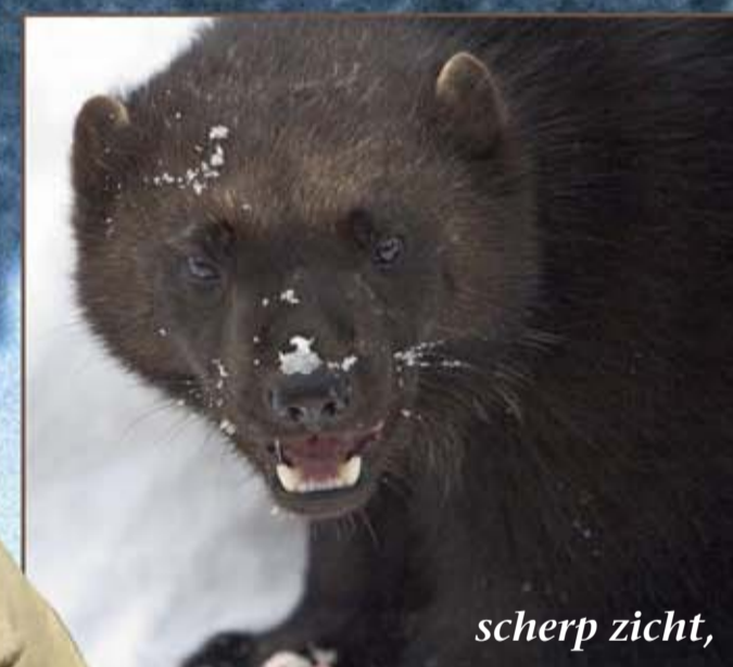
... scherp zicht,

Veelvraten komen niet veel voor in dierentuinen. Verdeeld over 25 parken leven slechts 60 dieren. Dit komt onder andere doordat veelvraten niet altijd evengoed te zien zijn in hun verblijf (het zijn eigenlijk schemerdieren, en ze leven solitair). Toch doen dierentuinen er alles aan om deze bijzondere toendradieren te beschermen. Daarom werd een Europees fokprogramma (EEP) opgezet. De veelvraten in GaiaPark doen ook mee in dit fokprogramma. Hoewel veelvraten zo'n 2-4 jongen per keer krijgen, is hun voortplantingsnelheid (ook in het wild) erg laag.